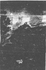
Sobre un cerro, casi inaccesible, se eleva el castillo de Olocau.