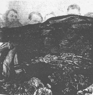
Gátova vista desde el pie del Aguila.