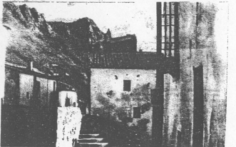
Una calle de Marina.