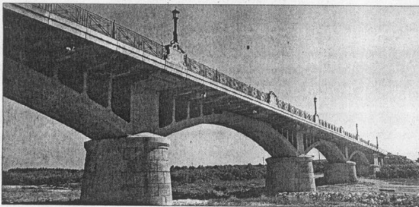
Puente sobre el río Albaida - Castelló de la Ribera