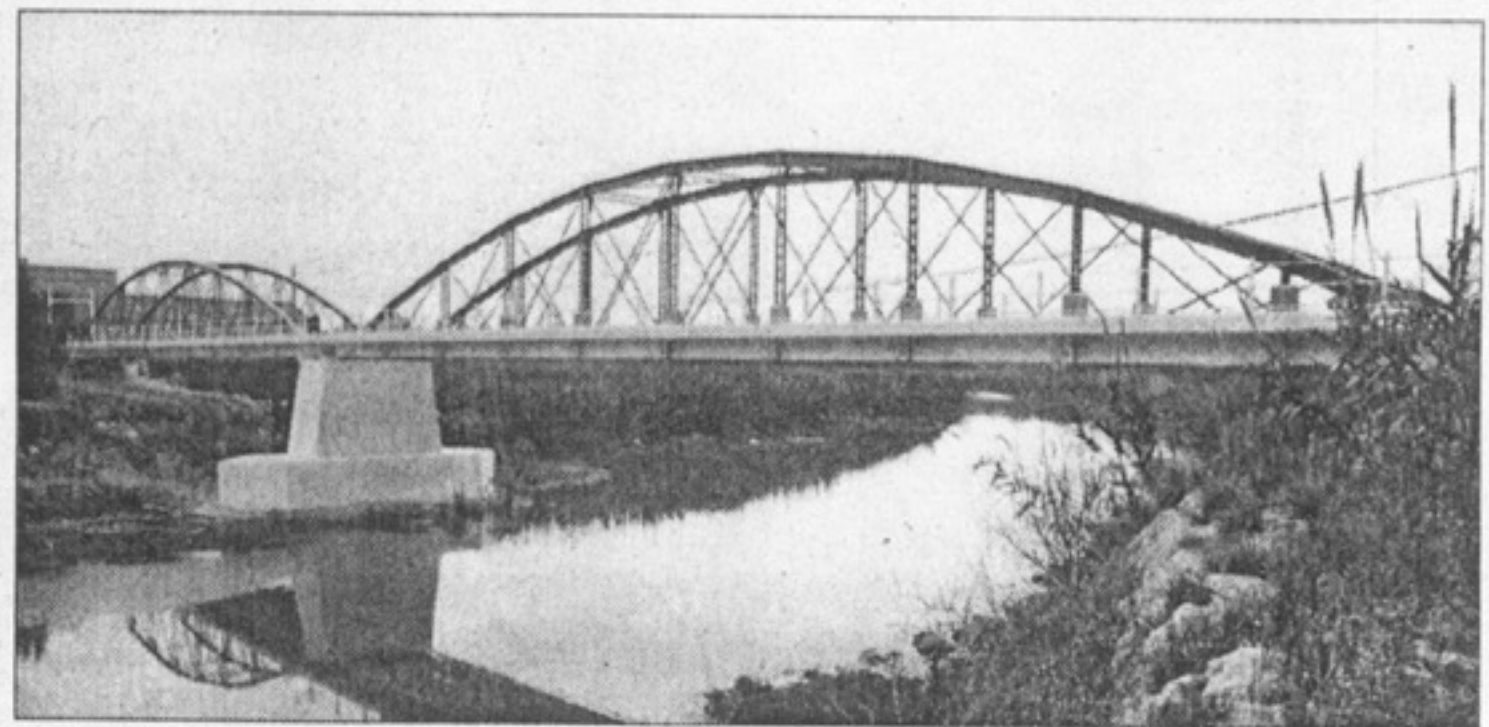
Puente sobre el río Júcar - Albalat de la Ribera