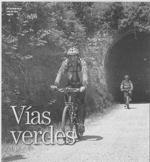
Un ciclista en la ruta de Ojos Negros.

De vías muertas a tramos llenos de vida, algunos trayectos ferroviarios abandonados se han convertido en una alternativa de ocio que cuenta cada día con más adeptos dentro de lo que se denomina turismo sostenible. Un libro de reciente aparición recoge las presentes en la Comunitat Valenciana.