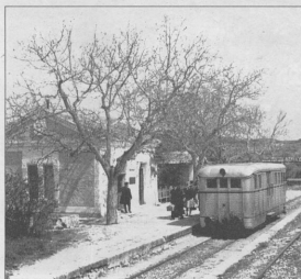
Arriba, comparativa fotográfica de una antigua aguada en la vía Alcoi-Gandia. A la izquierda, estación de Alfarr. Abajo, el autor en la vía verde de Alcoi-La Canal.