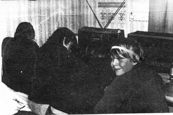
DX Club Källerea Sweden